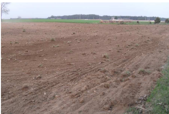
Fotografie 1 i 2. Wstępne przygotowanie terenu przez mieszkańców: oranie i bronowanie.