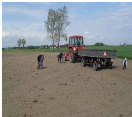
Fotografie 3 i 4. Wstępne przygotowanie terenu przez mieszkańców: zbieranie kamieni, darni i gałęzi.